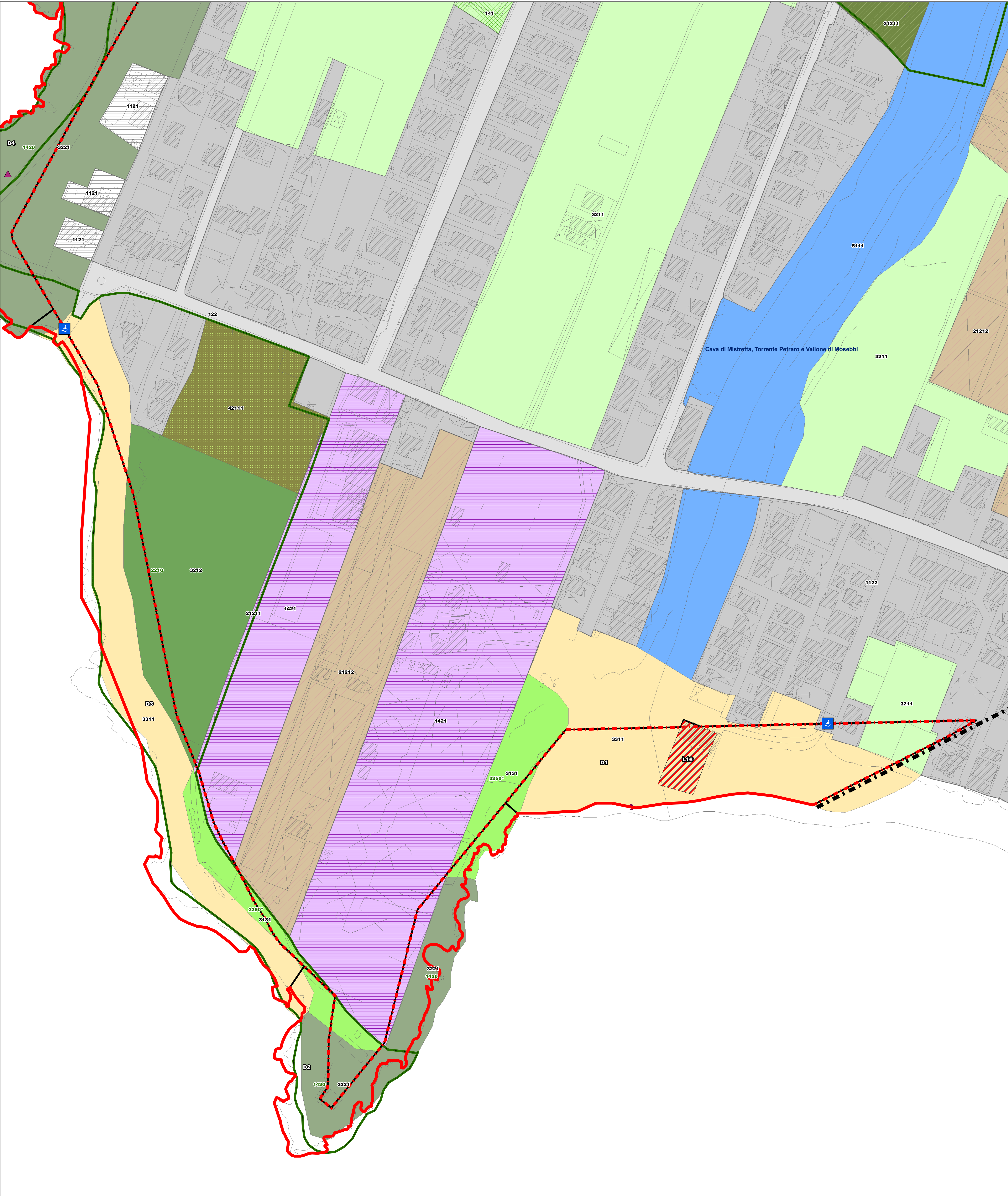
QUADRO 10 - Scala 1:1.000 (Cartografia SIDERSI)